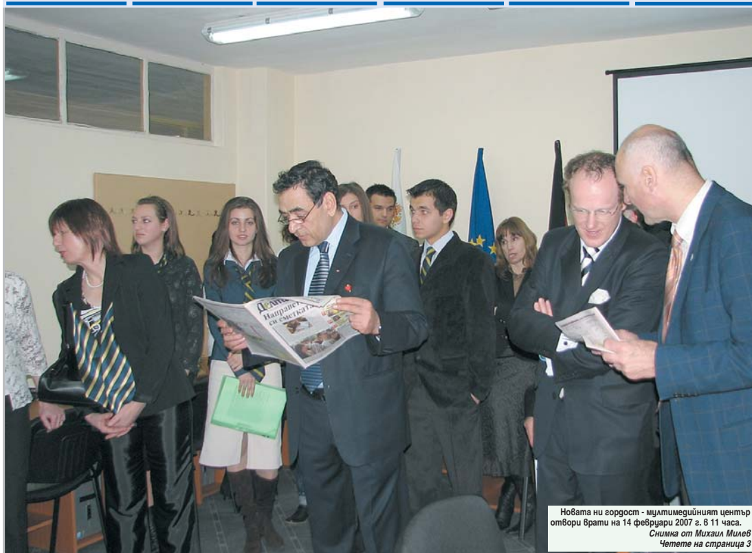
Новата ни гордост - мултимедийният център отвори врати на 14 февруари 2007 г. в 11 часа. Четете на страница 3