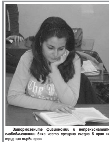
Затормозените физиономии и непрекъснатите главоблъсканици бяха често срещана гледка в края на трдния първи срок